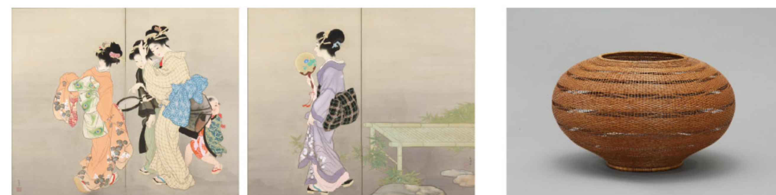
上村松園 《月蝕の宵》 1916年

その他、福田平八郎を中心とした京都の日本画、没後100年の節目となる 幕末の浮世絵師・右田年英の作品もご覧いただけます。