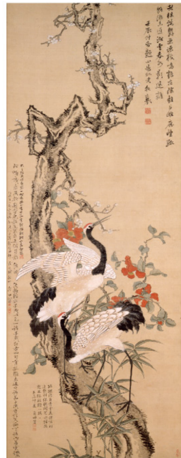
田能村竹田《歳寒三友雙鶴図》天保2(1831)年 個人蔵(大分県立美術館寄託)重要文化財

八幡信仰、禅宗、南蛮、豊後南画等の大分の美術が、中央の美術と関連しながらも異なる特徴を持ち、豊かに広がる様相をご紹介します。大友宗麟旧蔵の現存茶道具が初めて一堂に会す展示です。国宝・重文を含む貴重な美術工芸品約100点を公開します。