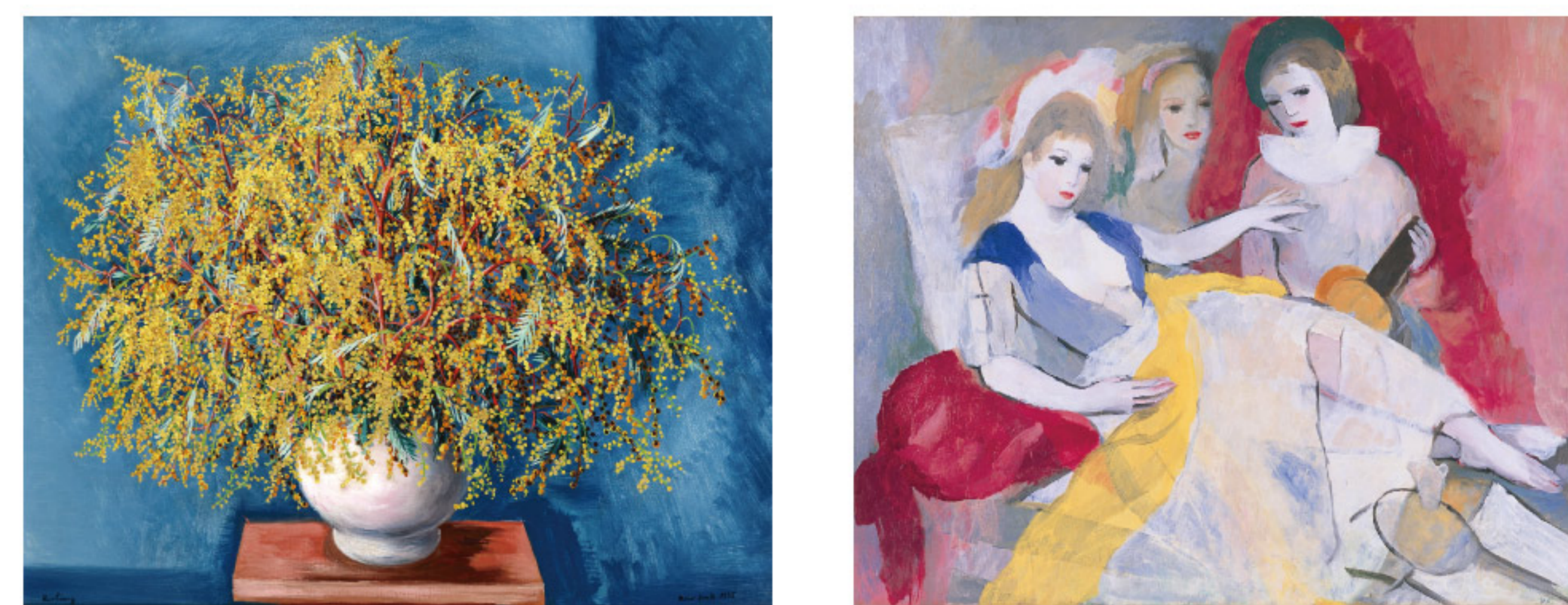
モイーズ・キスリング 《ミモザ》 1945年

その他、小鹿田焼の重要無形文化財指定30年を記念し、大分ゆかりの工芸に注目します。