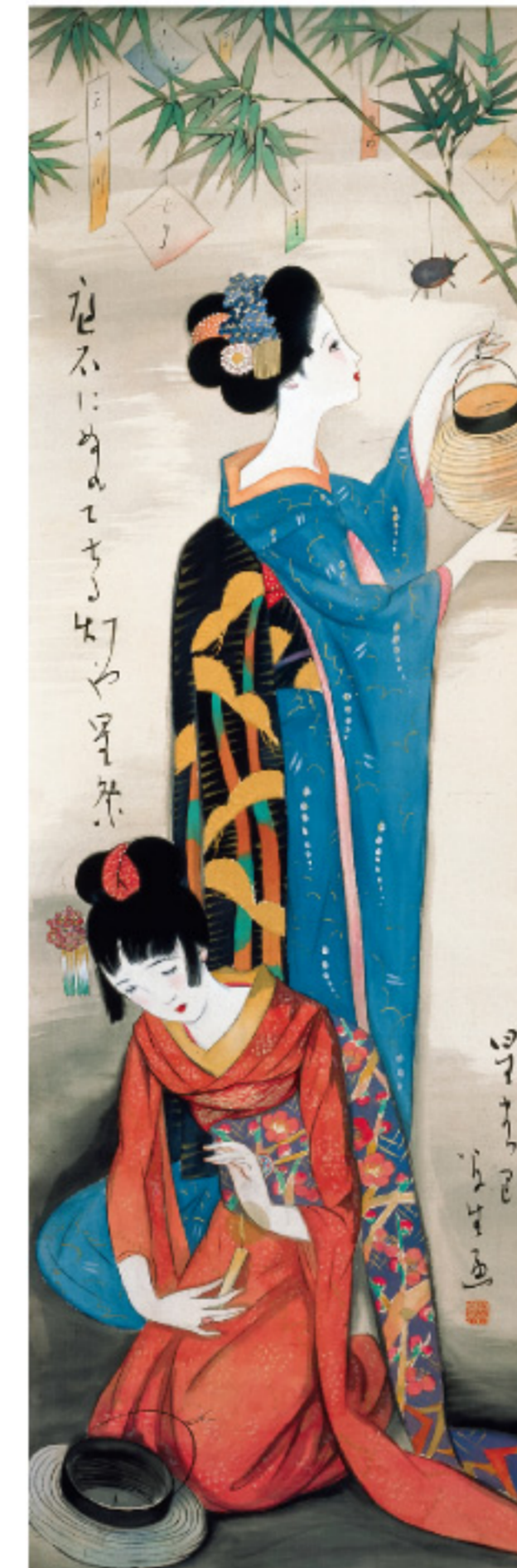
竹久夢二《星まつり》昭和初期 夢二郷土美術館蔵

大正ロマンを代表する竹久夢二の生誕140年を記念した最大規模の回顧展です。約180点の作品を展示し、情趣あふれる《星まつり》や、新発見の《アマリス》、初公開となる素描、《帯「いちご」》など珍しい意匠もご紹介します。独特の「かわいい」に触れながら、時代の立役者となった竹久夢二の魅力を存分にご堪能ください。