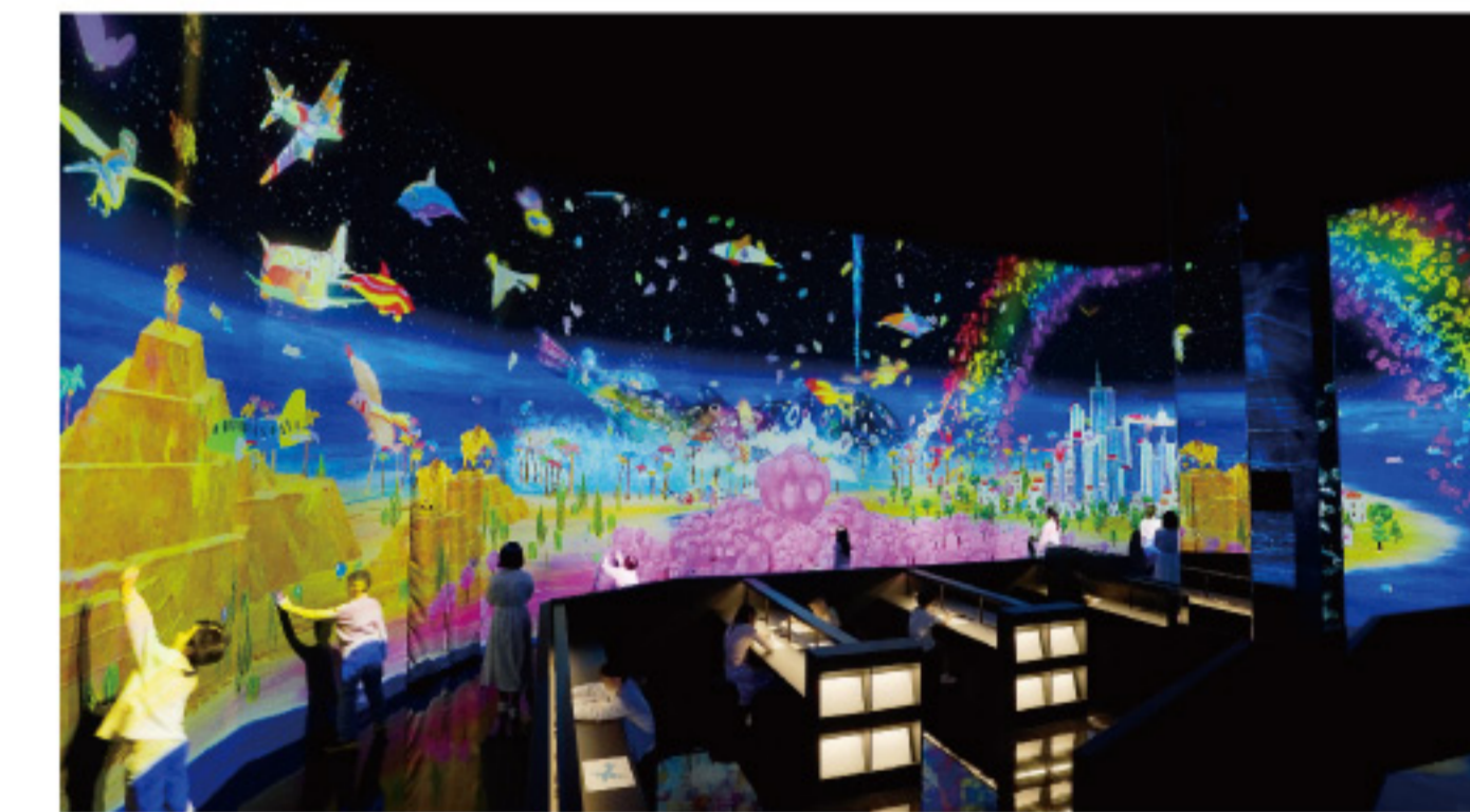
チームラボ《スケッチ環世界》©チームラボ

世界中で1500万人が体験した「チームラボ 学ぶ! 未来の遊園地と、花と共に生きる動物たち」を開催します。共創(共同的な創造性)をテーマにした教育的プロジェクトであり、子どもから大人まで楽しむ、他者と共に世界を自由に創造することを楽しめる展覧会です。